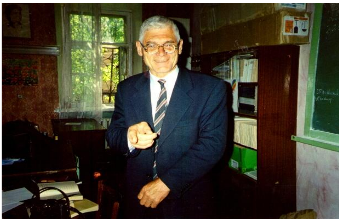
2005 р. «Запам'ятайте все, що я вам сказав»