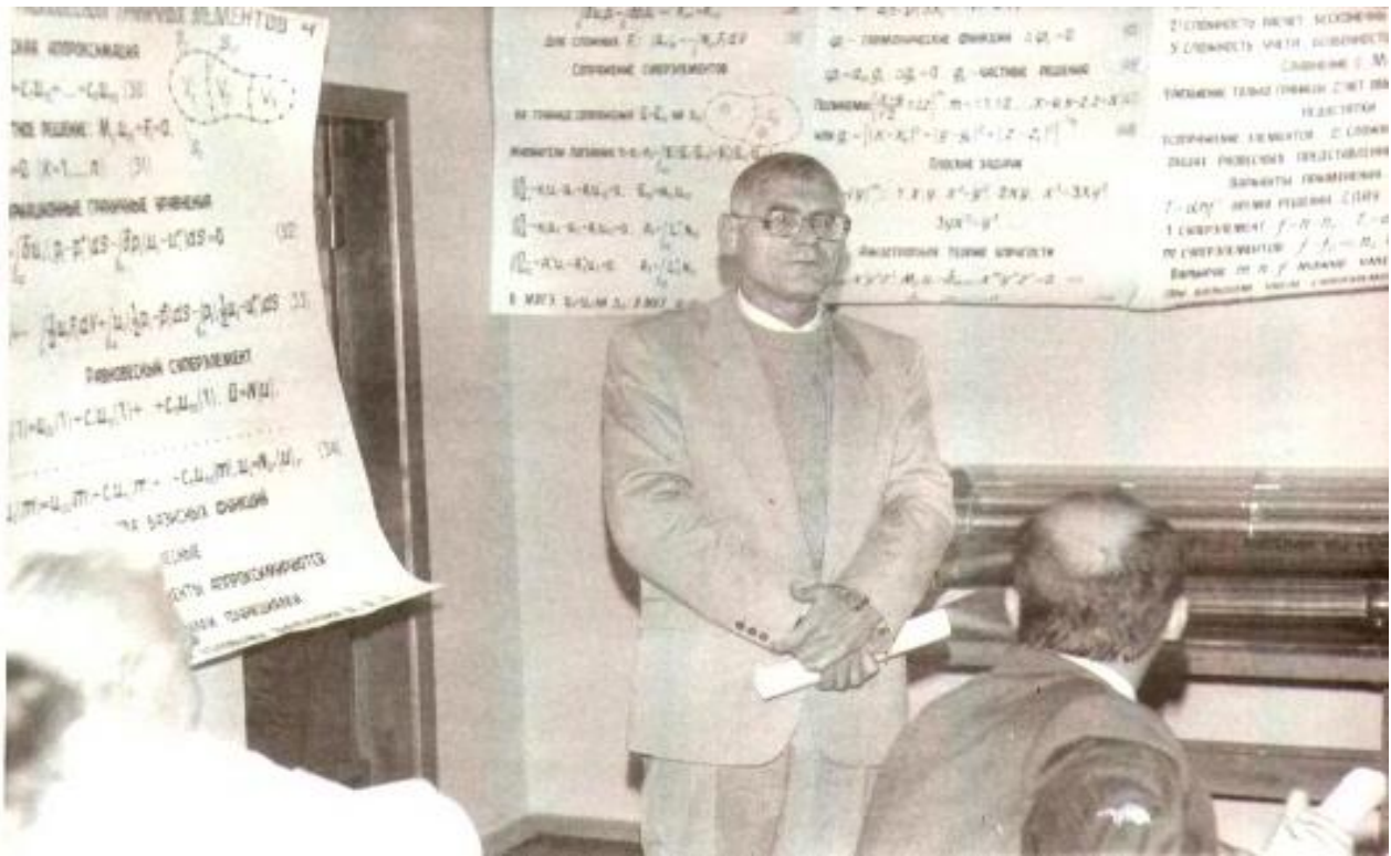
2005 р. захист кандидатської дисертації