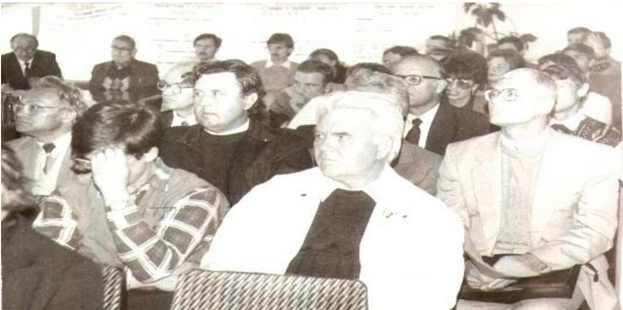
2005 р. Засідання спеціалізованої вченої ради в Інституті проблем машинобудування щодо захисту кандидатської дисертації