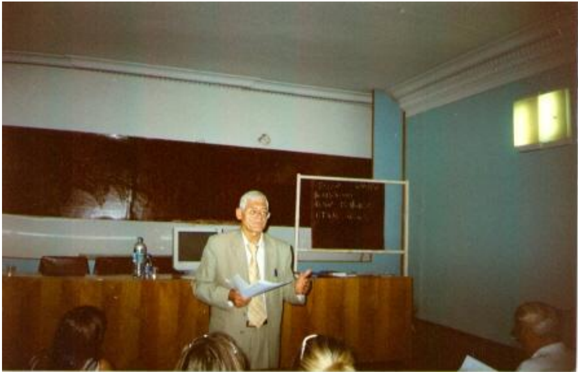
2005 р. с. Кацивелі, Велика Ялта