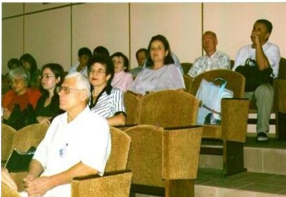
2011 р. Кацівелі, Велика Ялта