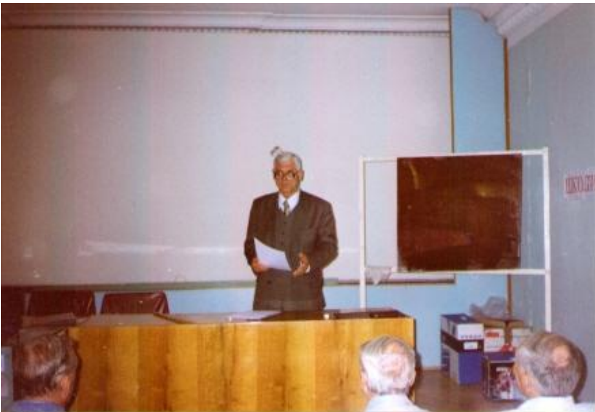
2003 р. с. Кацивелі, Велика Ялта