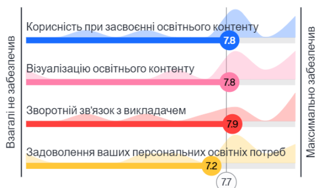
Рис. 2. Можливості онлайн-сервісу Mentimeter в підготовці до іспиту з гістології на думку студентів спеціальності 222 «Медицина»

Результати опитування показали також, що здобувачі вищої освіти спеціальності «Стоматологія» вважають, що онлайн-сервіс Mentimeter забезпечує зазначені можливості на 65% (задоволення персональних освітніх потреб) – 89% (взаємодія викладача з аудиторією) під час вивчення використання мікропрепаратів та електрограм у гістології (рис. 3) та на 75% (корисність у засвоєнні освітнього контенту) – 95% (зворотний зв'язок з викладачем) в підготовці до іспиту з гістології (рис. 4).