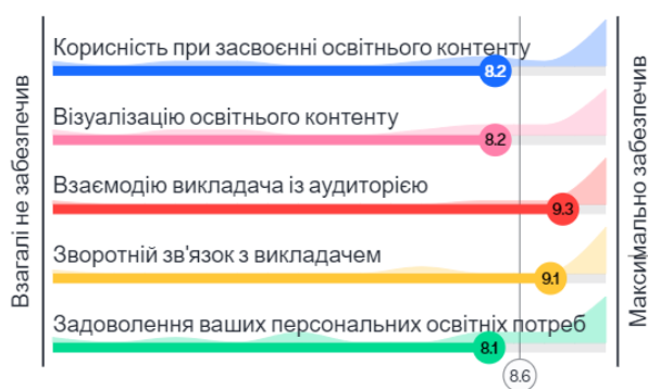
Рис. 1. Можливості онлайн-сервісу Mentimeter під час вивчення гістології на думку студентів спеціальності 222 «Медицина»

Результати опитування показали, що здобувачі вищої освіти спеціальності «Медицина» вважають, що онлайн-сервіс Mentimeter забезпечує зазначені можливості на 81% (задоволення персональних освітніх потреб) – 93% (взаємодія викладача з аудиторією) під час вивчення використання мікропрепаратів та електрограм у гістології (рис. 1) і на 72% (задоволення освітніх потреб) – 79% (взаємодія викладача з аудиторією) у підготовці до іспиту з гістології (рис. 2).