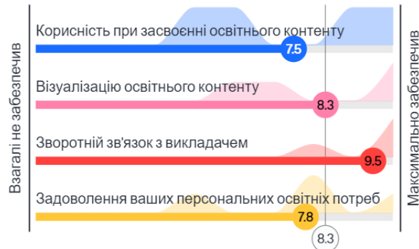
Рис. 4. Можливості онлайн-сервісу Mentimeter в підготовці до підсумкових занять з гістології на думку студентів спеціальності 221 «Стоматологія»

Отже, проведені анонімні опитування здобувачів вищої освіти спеціальностей 222 «Медицина», 221 «Стоматологія» показали високу корисність онлайн-сервісу Mentimeter для візуалізації освітнього процесу як під час вивчення освітнього компонента «Гістологія», так і в підготовці до підсумкових занять/іспиту з цього освітнього компонента.