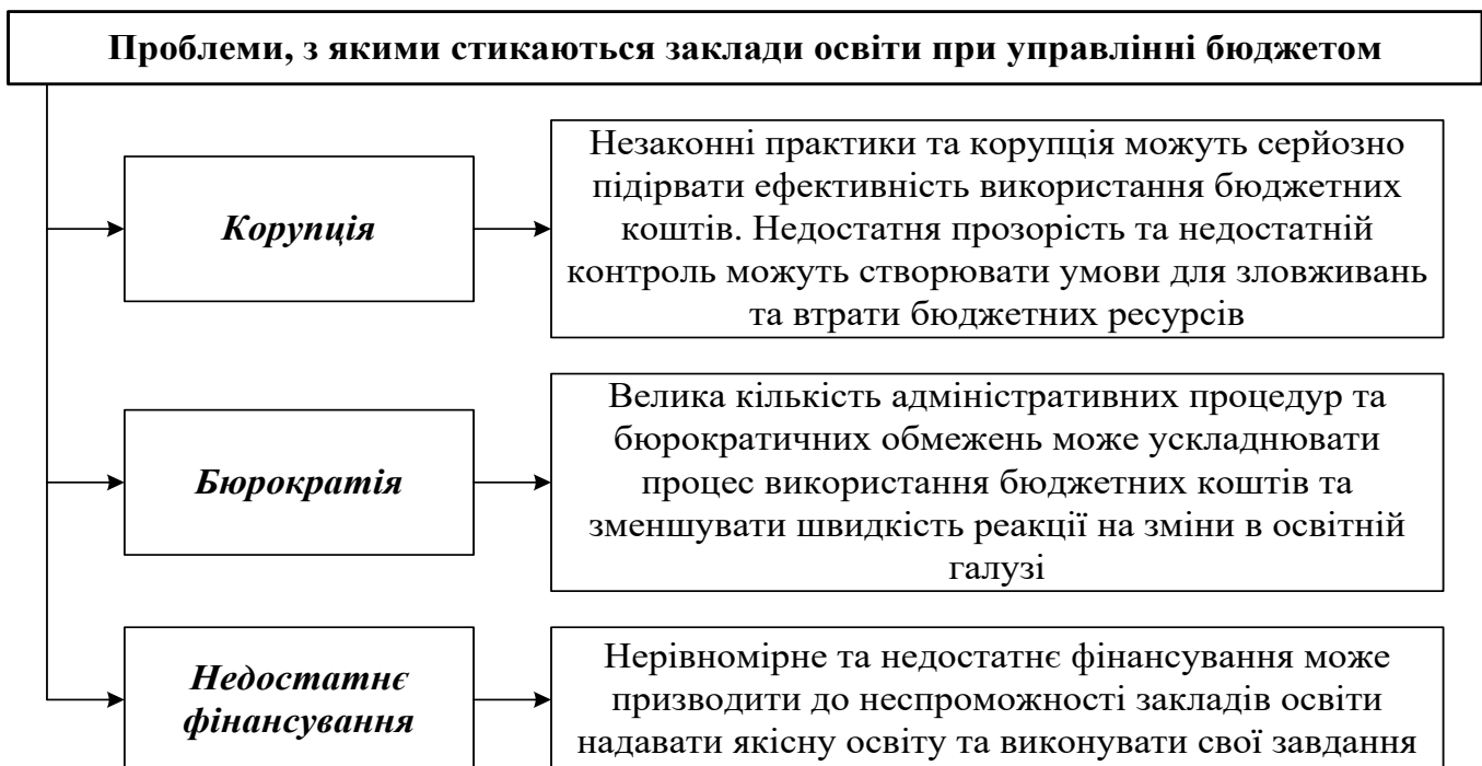
Рис. 1. Проблеми, з якими стикаються заклади освіти при управлінні бюджетом Науково-теоретичний підхід до управління виконанням бюджету закладів освіти представлено на рис. 2.

Поринувши глибше в аналіз проблем, з якими стикаються заклади освіти при управлінні бюджетом, можна виділити кілька важливих аспектів, які представлено на рис. 1.