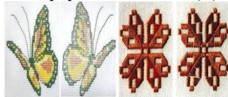
Рис. 6 Вигляд вишивки з лицьового і виворітного боків: а - вишивка хрестиком; б — вишивка «пряма гладь»

Окрім шерстяних, бавовняних, шовкових та синтетичних ниток різні техніки вишивання використовують: бісером - це дрібні скляні намистини пришивають у техніці “напівхрестик”. Слід зауважити, що вишиванка із бісером — річ важка. Іноді вага вишитої бісерної сукні може сягати 5 кг. Через це особливо уважно підбирають тканини для техніки вишивки бісером. Якщо техніка передбачає оздоблення бісером, то це має бути або легкий візерунок, який не деформує тканину, або міцний матеріал (льон, бавовна, оксамит, шкіра), стеклярус - цими видовженими бісеринами часто прикрашають край рукава та низ сукні, туніки. Слід уникати надто довгої бахромки зі стеклярусу, бо вона буде зачіплятися за предмети та речі. Паєтки - блискучі пластинки створюють яскравий, неповторний образ. Техніка вишивання паєтками підійде для оздоблення сукні на випускний, весілля. А от в діловому образі ці блискітки будуть недоречними.