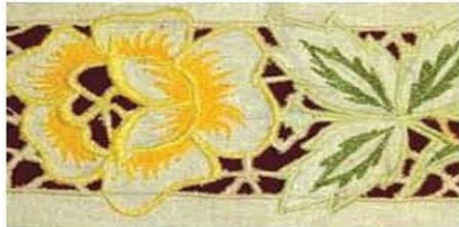
Рис. 5 Прорізна гладь

гладдю або петельним швом, після чого тканину всередині цих швів вирізають. На місцях вирізаної тканини можуть прокладатися бриди, павучки, ажурні сітки. За зовнішнім виглядом з лицьового і виворітного боків усі техніки вишивання поділяють на одnobічні і двобічні. Прозоро лічильні техніки вишивання виконують на місці висмикнутих із тканини ниток. До цієї групи вишивок належать різні види мережок (Рис. 4). Одnobічні техніки вишивання утворюють візерунок лише з лицьового боку виробу (хрестик, назад голку, гобеленний шов, курячий брід, полтавська гладь тощо), а з виворітного — лише окремі стібки й переходи ниток (Рис. 6, а). Двобічні техніки вишивання утворюють візерунок вишивки, однаковий з лицьового і виворітного боків (качалочки, кривулька, верхоплут, пряма гладь (лиштва), штапівка, солов'їні вічка, двобічна гладь, прорізна гладь тощо) (мал. 6, б).