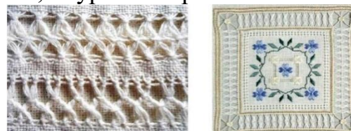
Рис 4 Мережки