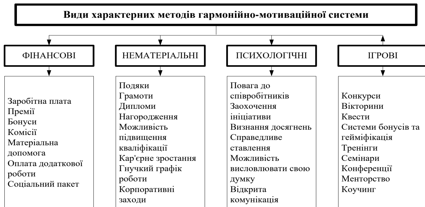
Рис. 1. Види характерних методів гармонійно-мотиваційної системи

почуттями. Тому важливим аспектом механізму формування налагодженої гармонійно-мотиваційної системи підприємства є удосконалення процесу мотивації з урахуванням соціальних ресурсів й потреб співробітників та підтримання гармонійної корпоративної культури.