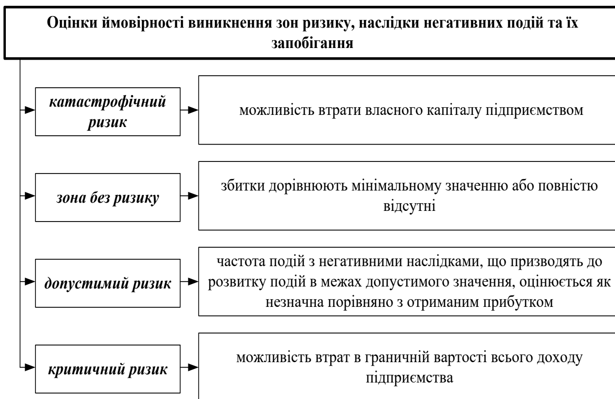
Рис. 3. Оцінки ймовірності виникнення зон ризику, наслідки негативних подій та їх запобігання

Одна із складних процедур опису ризику необхідна для оцінки ймовірності виникнення ризику та наслідків негативних подій та їх запобігання (рис. 3).