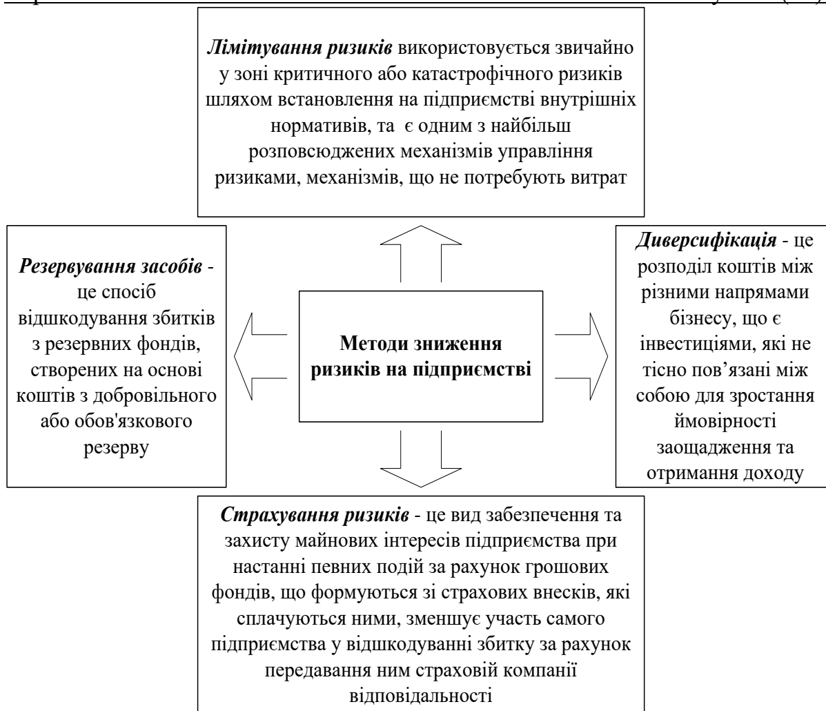
Рис. 4. Методи зниження ризиків на підприємстві

У випадку уникнення ризику повністю необхідно відкидати будь-які заходи, які можуть бути запропоновані для його зменшення. Цей рішучий захід зводить ризик до значного зниження.