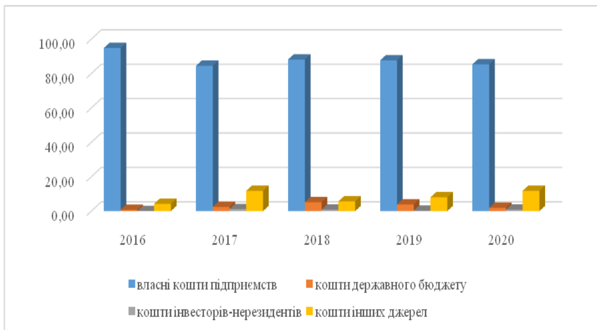
Рис. 2. Структура джерел фінансування інноваційного розвитку промислових підприємств за 2016-2020 р.р.*

Джерела фінансування процесу інноваційного розвитку промислових підприємств (рис. 2) має якісно іншу структуру фінансових ресурсів ніж фінансування поточної діяльності. Майже на 80% інноваційний розвиток промислових підприємств відбувається за власні кошти підприємств. Незначною долею участі в інноваційному розвитку відзначаються фінансові ресурси держави та інших джерел.