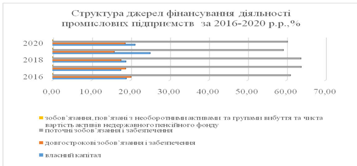
Рис. 1. Структура джерел фінансування (фінансових ресурсів) поточної діяльності промислових підприємств за 2016-2020 р.р.*

Відомо, що однією з основних характерних ознак фінансових ресурсів є поділ їх на ресурси внутрішнього та зовнішнього походження, фондову та нефондову форми. Внутрішні фінансові ресурси промислового підприємства формуються внаслідок його поточної діяльності або розширеного відтворення, формування зовнішніх ресурсів відбувається на взаємовигідних умовах між учасниками ринкових відносин (промисловим підприємством, державними установами, фінансовими посередниками, іноземними суб'єктами і т.п.). Але в складних сучасних умовах функціонування промислових підприємств, в умовах воєнної агресії та ведення активних бойових дій на деяких територіях держави, постає питання відновлення, перегляду складу та структури формування й використання фінансових ресурсів залежно від цілей діяльності підприємств. Підставою для таких висновків стало аналітичне дослідження, що проведено відповідно до офіційної статистичної інформації [2, 5] за 2016-2020 роки. Нажаль, внаслідок подій що відбуваються, не вся актуальна інформація з офіційних джерел оновлена, тому, щодо співставлення даних, обрано саме цей період дослідження, результати якого приведено на рис. 1 та 2.