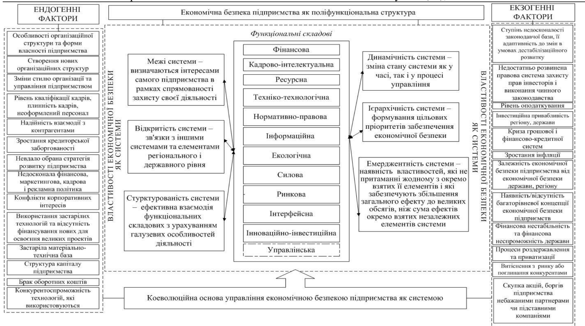
Рис. 1 Коеволюційна основа управління економічною безпекою підприємства як системою