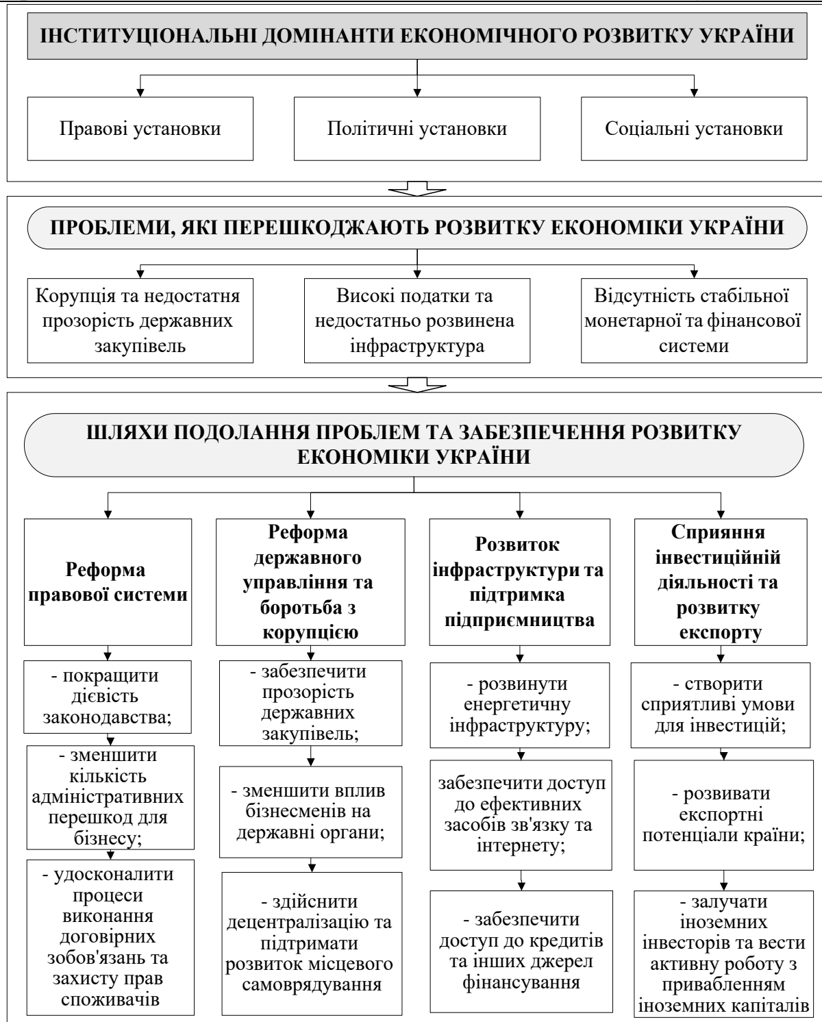
Рис.1. Інституціональні домінанти у формуванні економічної системи України

Україна є правовою державою, але існує багато проблем з її реалізацією.