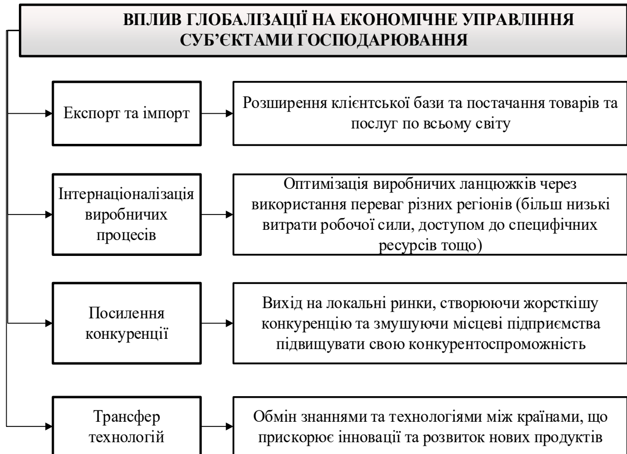
Рис. 1. Вплив глобалізації на економічне управління суб'єктами господарювання

виробничих процесів дозволяє суб'єктам господарювання оптимізувати виробничі ланцюжки, використовуючи переваги різних регіонів.