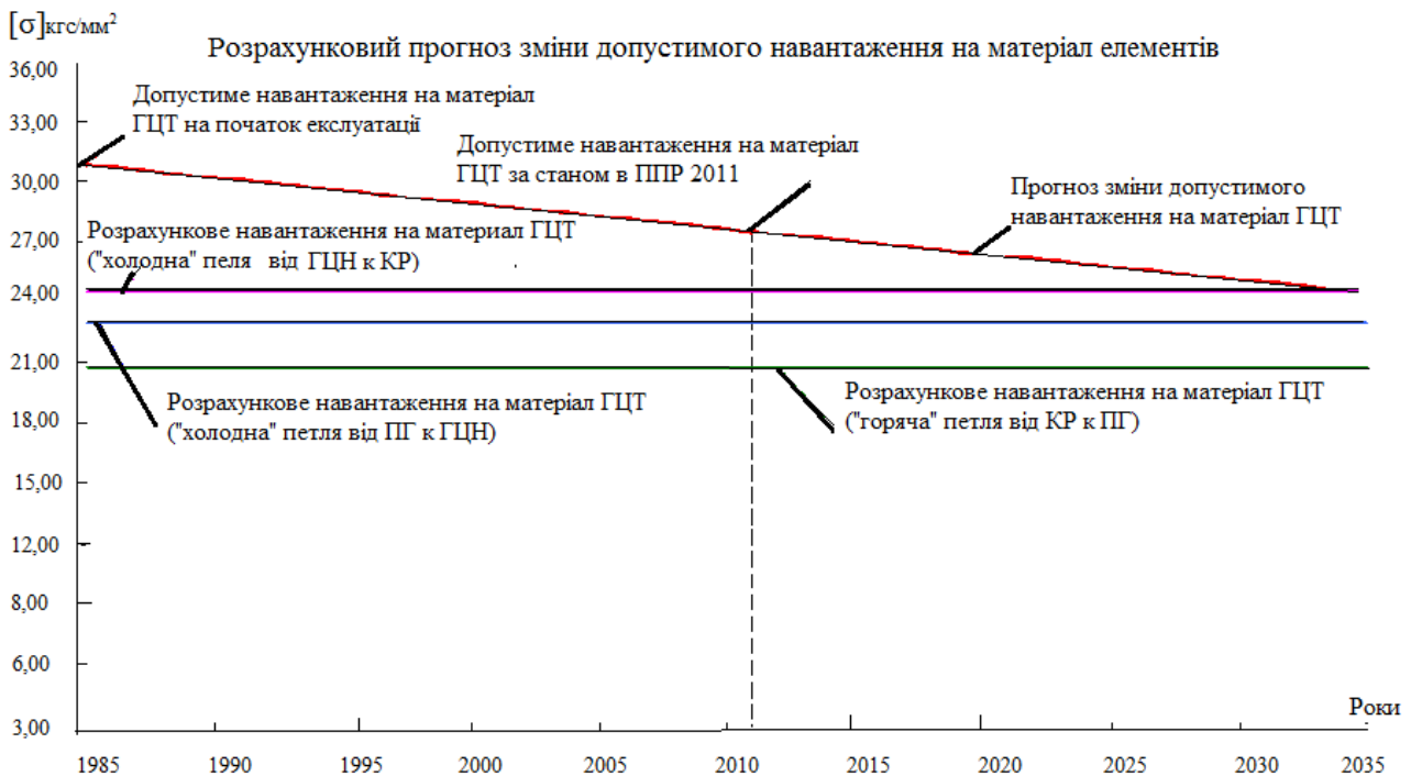
Рис. 3 – Розрахунковий прогноз зміни допустимого навантаження на матеріал елементів ГЦТ

З метою уточнення прогнозних графіків зміни допустимого навантаження на основний метал ГЦТ, ГЗЗ і трубопроводу зв'язку КО з «гарячої» ниткою петлі №4 ГЦК в якості рекомендацій з управління старінням необхідно запланувати і виконати під час проведення капітального ремонту в період планово-попереджувального ремонту ППР-2024 контроль металу.