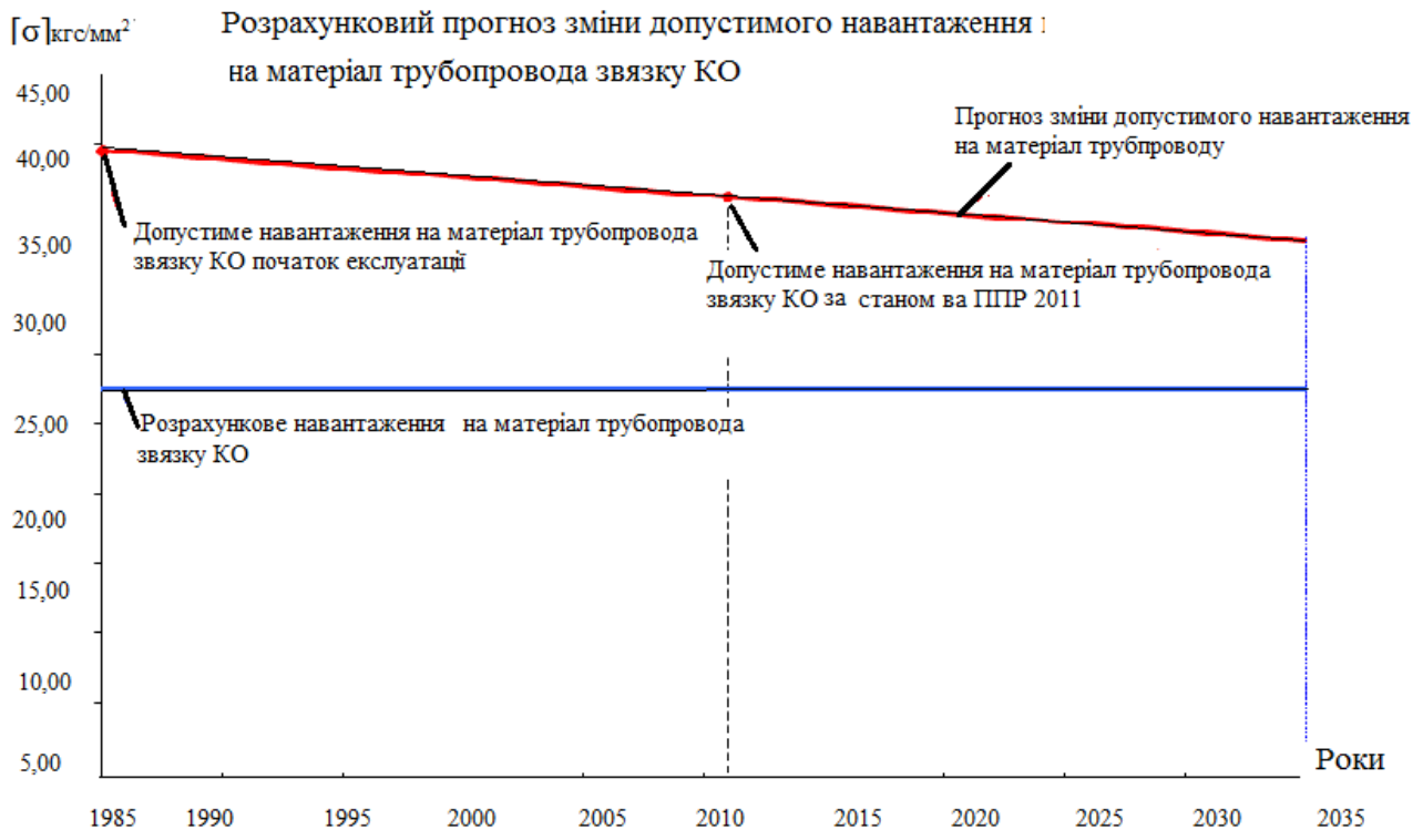
Рис. 5 – Розрахунковий прогност змiни допустимого навантаження на матерiал трубопровода зв'язку КО з «горячої» ниткою петлі №4 ГЦК