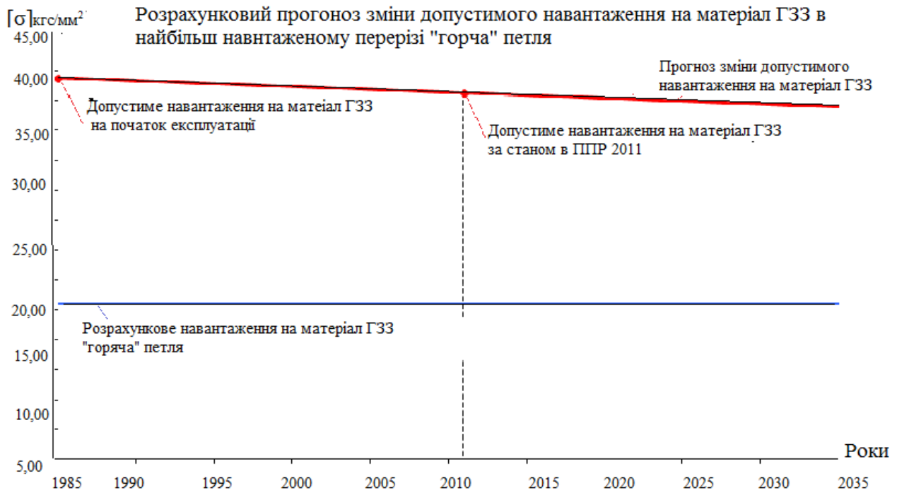
Рис. 4 – Розрахунковий прогност змiни допустимого навантаження матерiал ГЗЗ в найбільш навантаженому перерiзi «горяча» петля