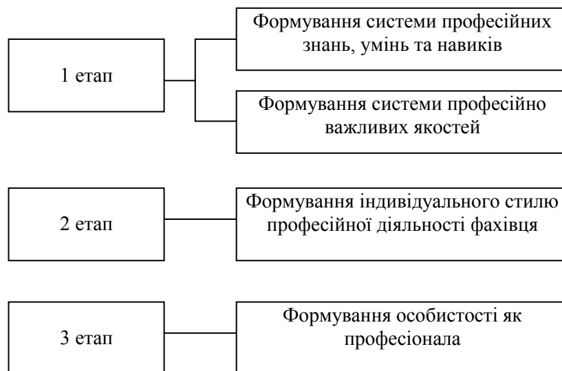
Рис. 1. Етапи формування творчої особистості інженера - технолога

Виділяють третій етап – формування інженера-технолога як професіонала. Крім знань, умінь, навичок, професійно важливих якостей та досвіду інженер-технолог повинен мати визначені компетенції, здібності до самоорганізації, відповідності та професійній надійності. Професіонал здатен знайти проблему, сформулювати задачу та знайти її вирішення. Це найвищий рівень професійного становлення особистості, для досягнення якого необхідно ще від 7 до 10 років.