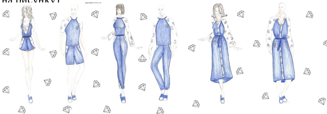
Рисунок 1 - Авторські комплекти домашнього одягу

На думку психологів саме в виборі домашнього одягу визначається ставлення жінки до самої себе. Дуже часто використовується таке висловлювання: «Подивися на одяг жінки, і зрозумієш любить чи вона себе». Дослідники з області дизайну і моди розподіляють домашній одяг на комплекти, які поєднуючись між собою створюють композицію затишку та гармонії. Комплекти домашнього одягу представлені на рисунку 1