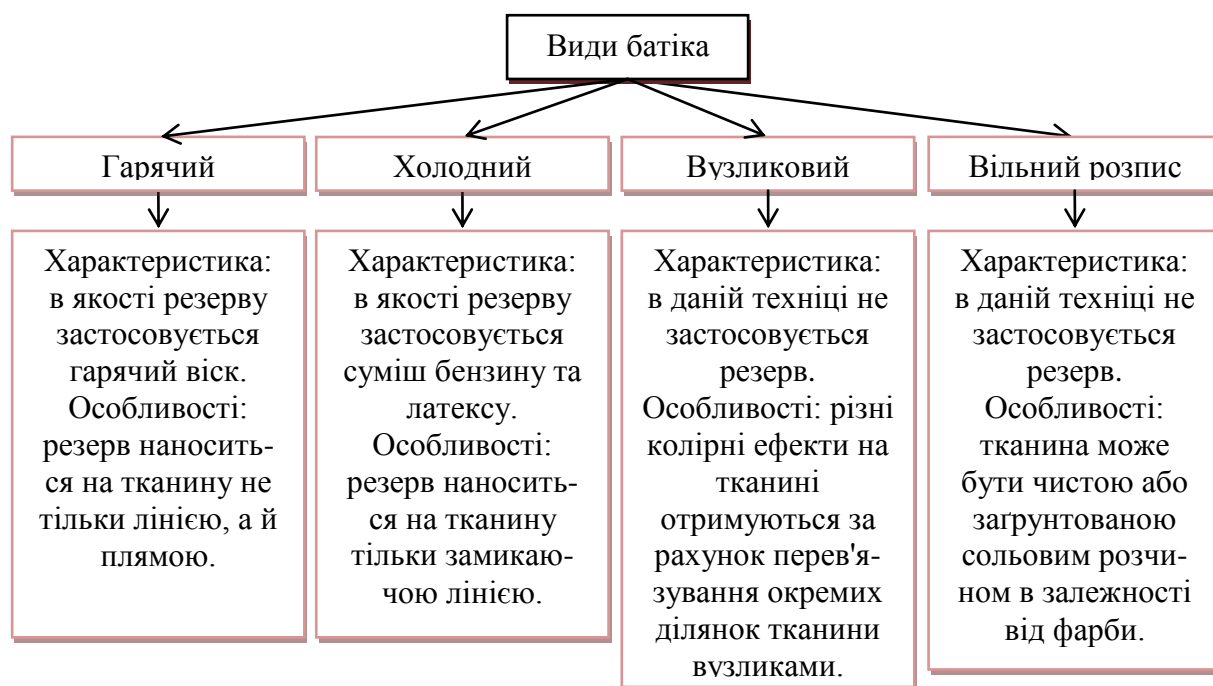
Рис.1 Види батика

Існує кілька видів батіку: гарячий батік, холодний батік, вузликовий батік, вільний розпис (рис. 1).