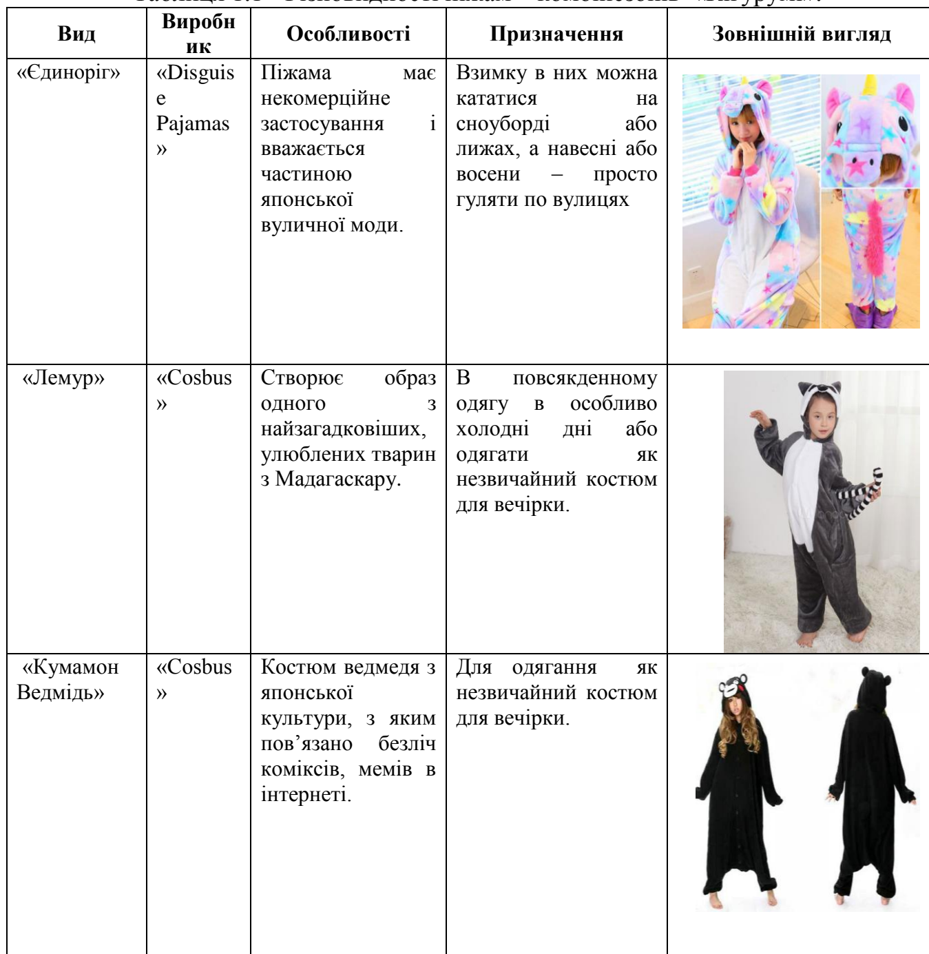
Таблиця 1.1 - Різновидності піжам – комбінезонів «Кігурумі».

Різновидності піжам – комбінезонів «Кігурумі», представлені в таблиці 1.1.