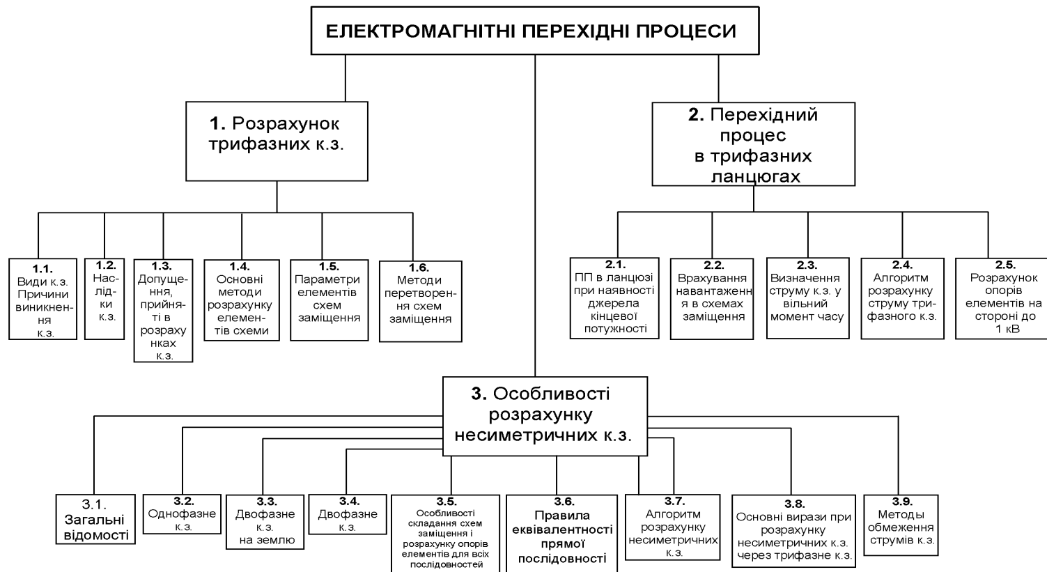
Рис. 2. Система знань із дисципліни «Електромагнітні перехідні процеси» (навчальні елементи верхніх рівнів)