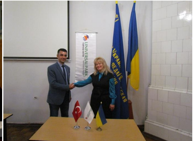
Представники Міністерства освіти Туреччини та часних освітніх компаній