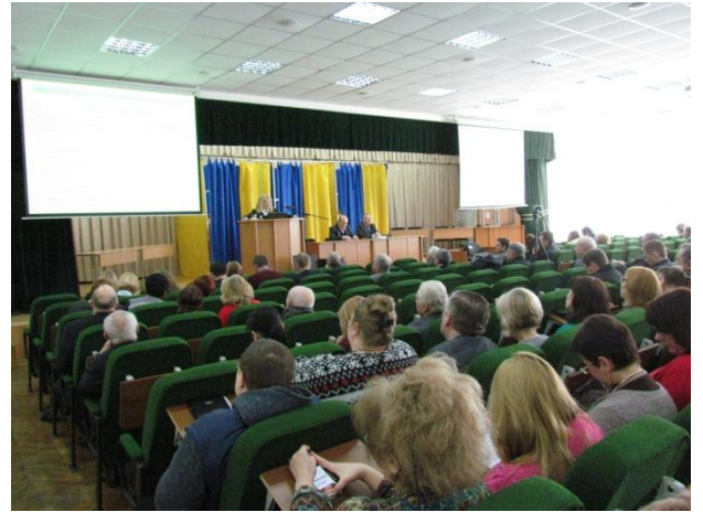
Вибори ректора УПА