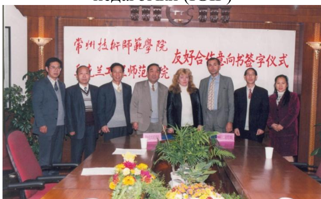
Під час підписання угоди про співробітництво між УПА та Професійно-технічним університетом провінції Цзянсу (м. Чанчжоу, КНР)