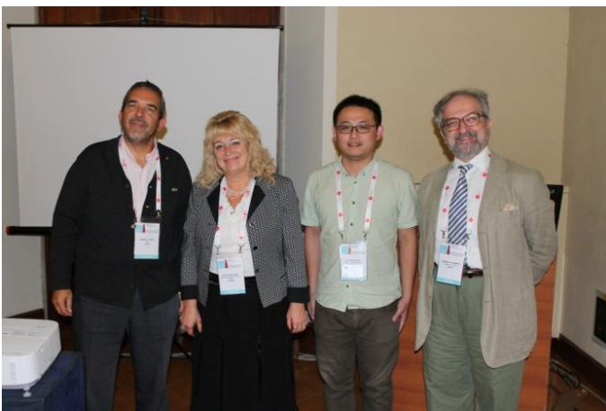
Конференція IGIP, Італія, Флоренція