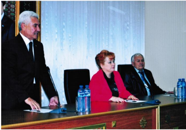
Рада ректорів. Туркменістан