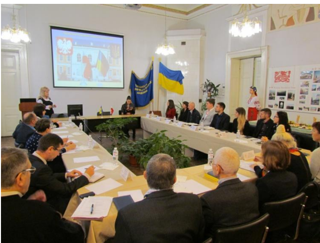
Делегація представників ВНЗ та міської влади м. Люблин, Польща