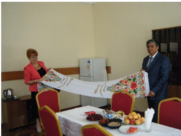
Візит до Таджикистану