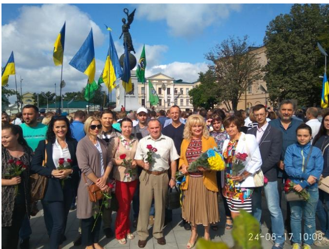
Покладання квітів з нагоди Дня Незалежності