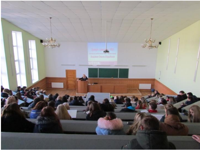
Зустріч зі студентами