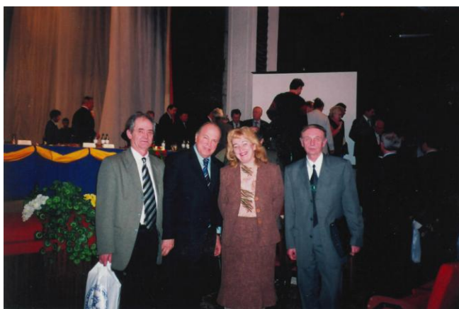
Після засідання Національного моніторингового комітету України міжнародного товариства з інженерної педагогіки (IGIP)