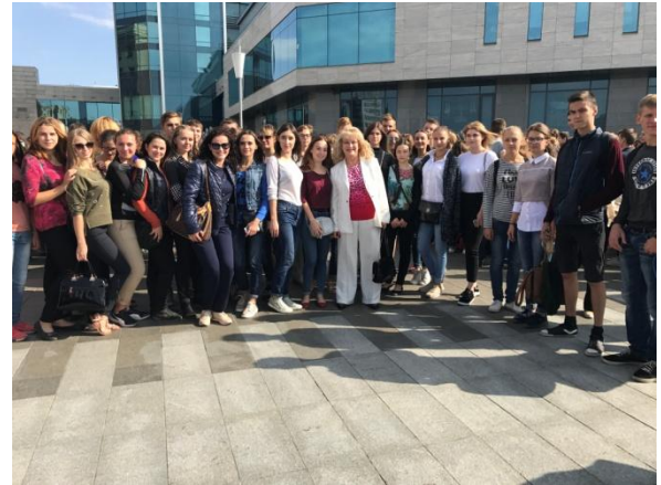
Зі студентами на урочистостях з нагоди 100- річчя Ун-ту мистецтв ім. Котляревського