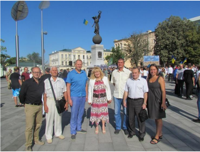
Покладання квітів на День Міста та День прапора