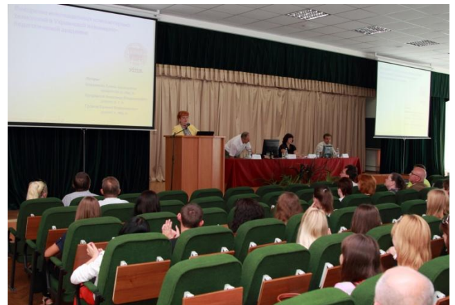
Конференція «Якість технологій – якість життя», УПА