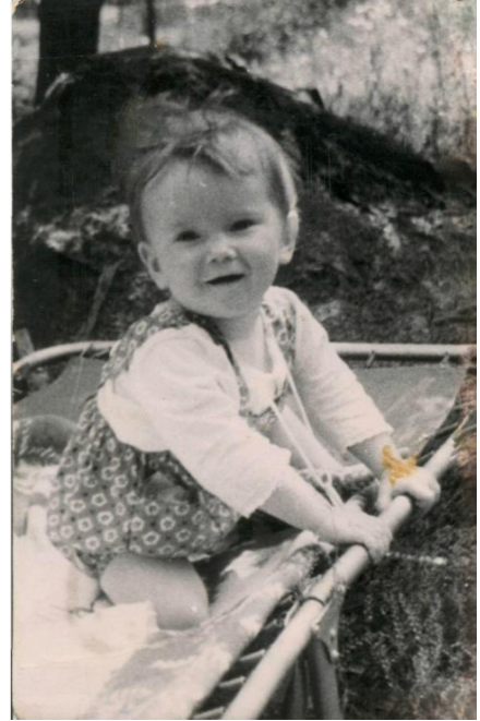
Олена у дитинстві