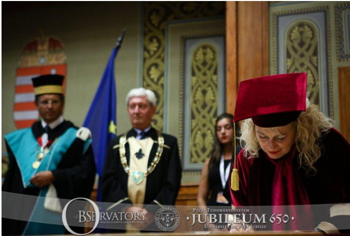
Мagna Charta Universitatum (Великая Хартия Университетов)