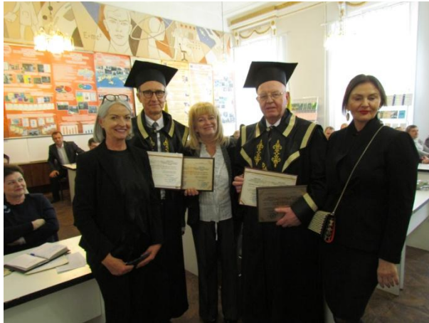
Вручення дипломів почесних професорів УПА