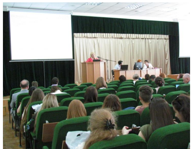
Конференція на базі УПА по психології