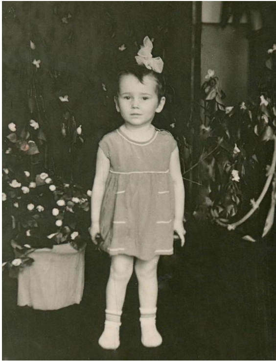
Олена у дитинстві