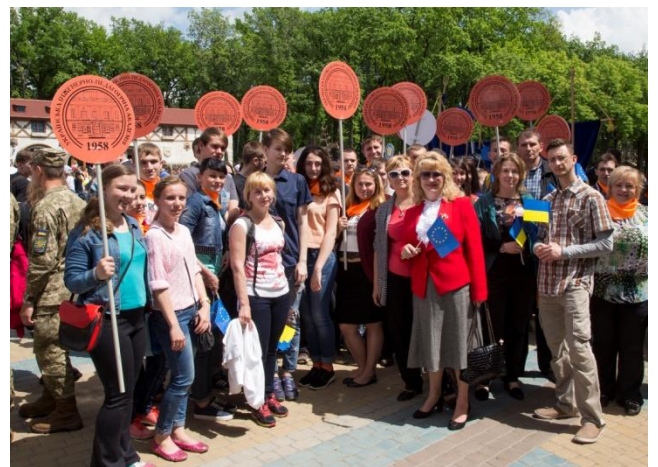
Загальноміське свято День Європи 22.05.2016