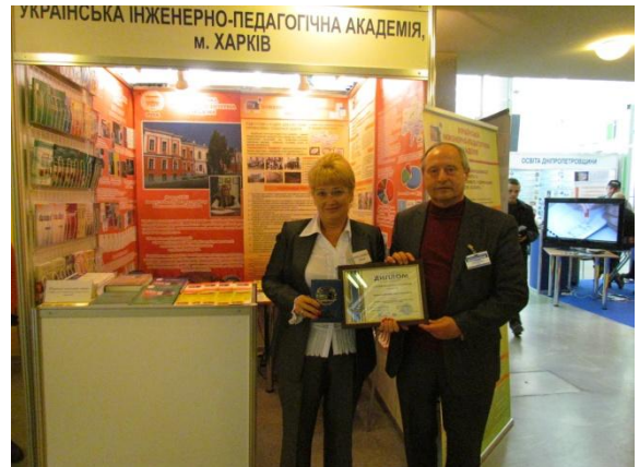
Виставка «Інноватика в сучасній освіті»