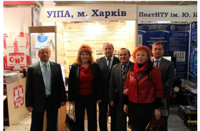
Международный форум, Днепропетровськ