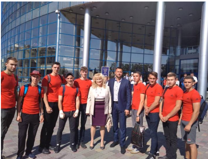
Міжнародний день спорту