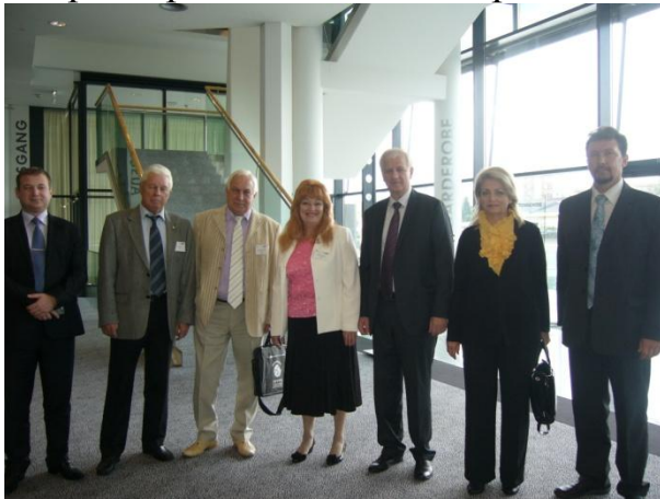
Конференція IGIP Австрія, Филлах