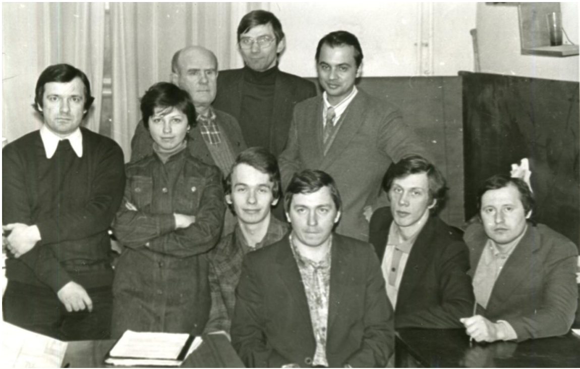
Співробітники кафедри промислової електроніки ХПІ, 1984 р.