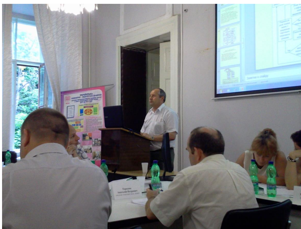
Виступ на науковому семінарі, 2011 р.