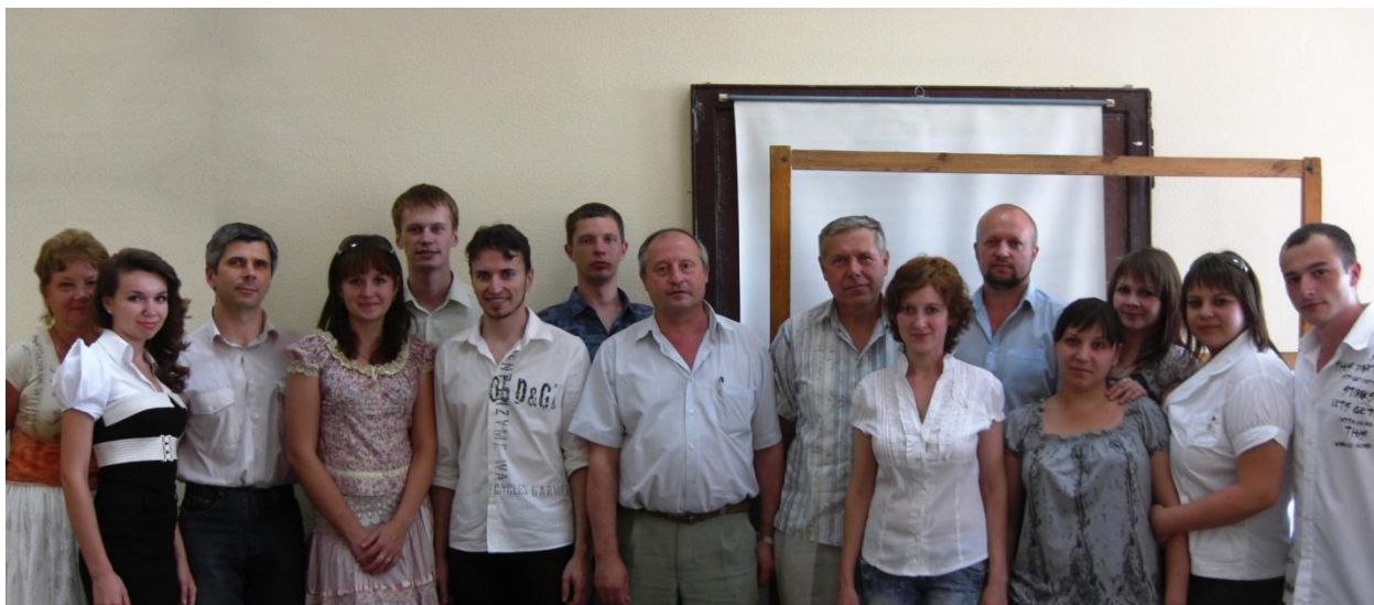
Співробітники кафедри інтелектуальної власності зі студентами-магістрантами