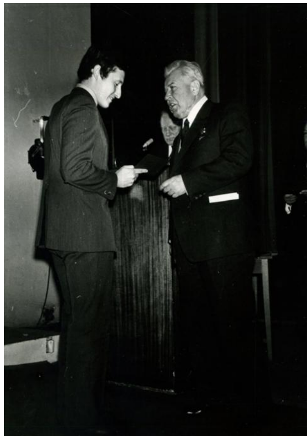
Вручення диплома, ХІІІ, 1978 р.