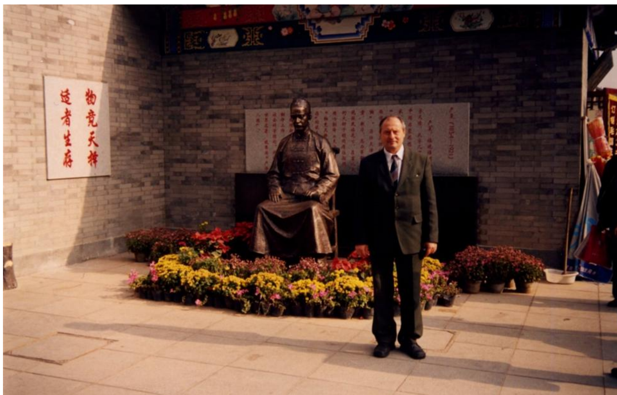
На конференції у Китаї, 2004 р.