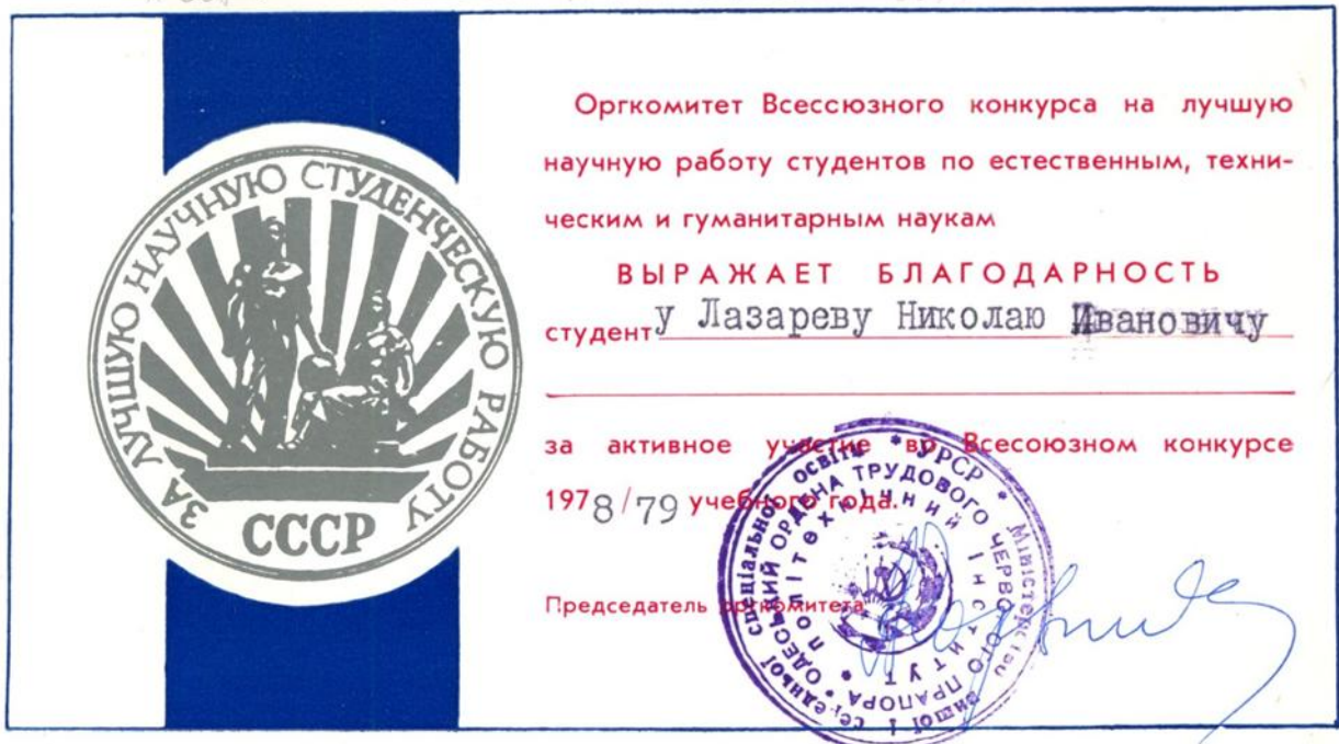
Подяка за кращу наукову студентську роботу