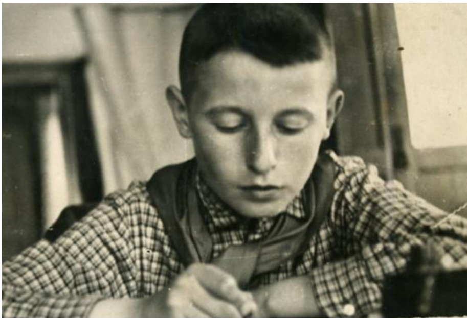
Шкільні роки, 1965 р.