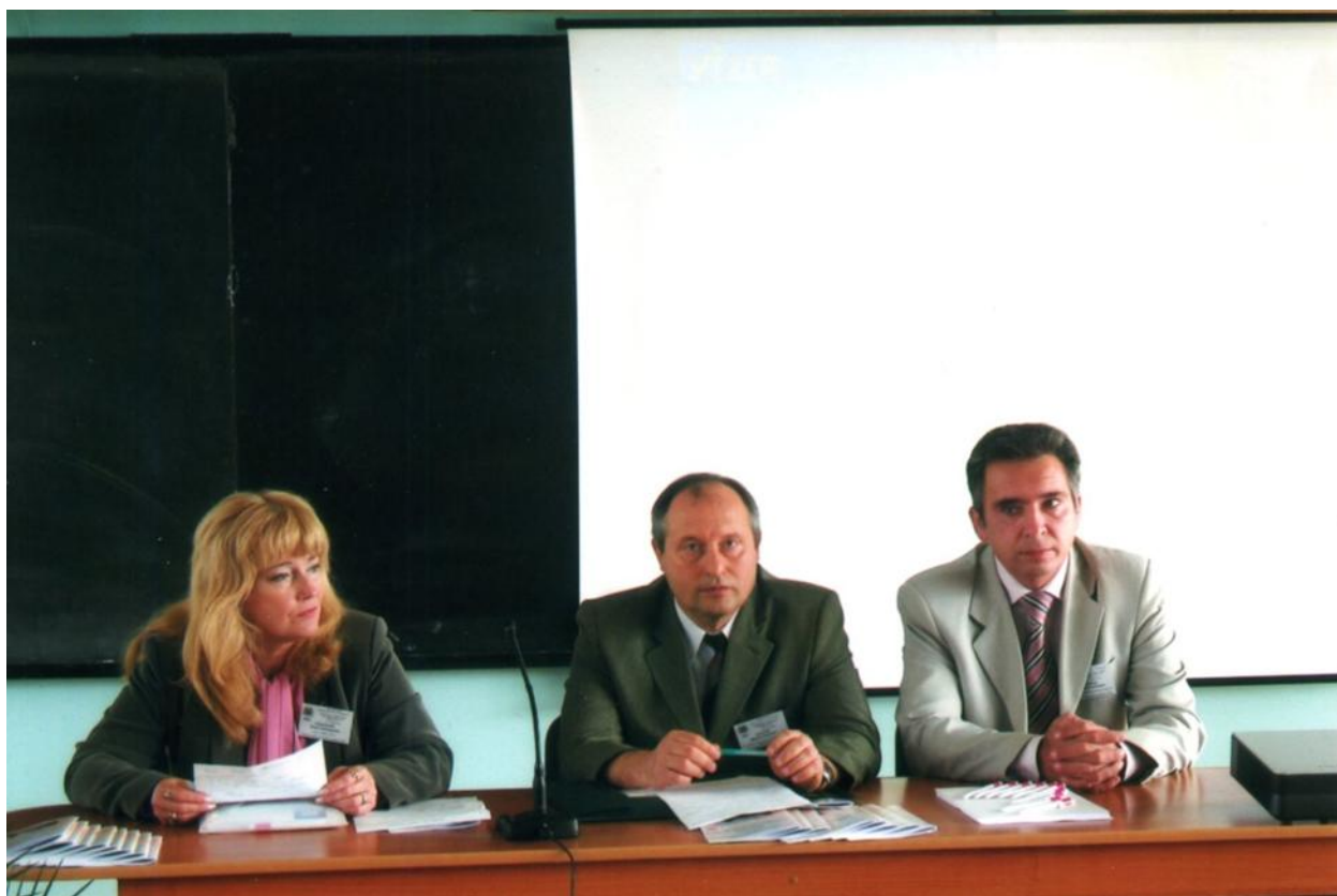
У президіумі конференції, м. Артемівськ, 2011 р.