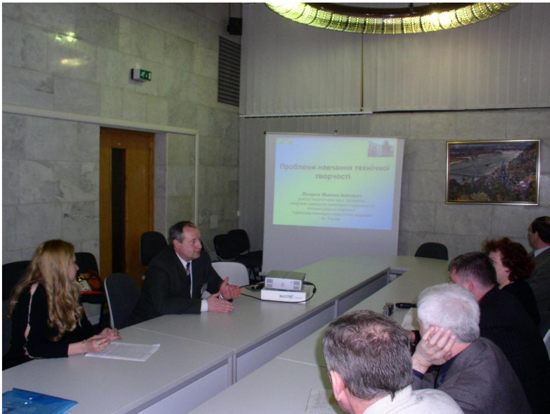
Круглий стіл в Українському домі, м. Київ, 2009 р.