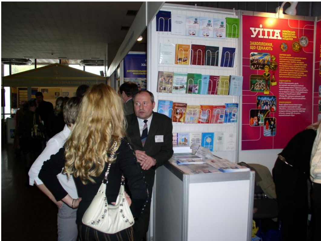
Презентація УІПА у м. Київ, 2009 р.