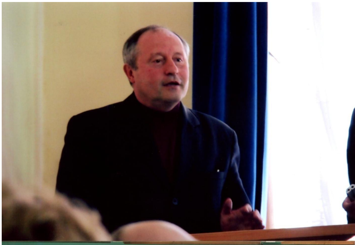
На лекції студентам УПА, 2012 р.