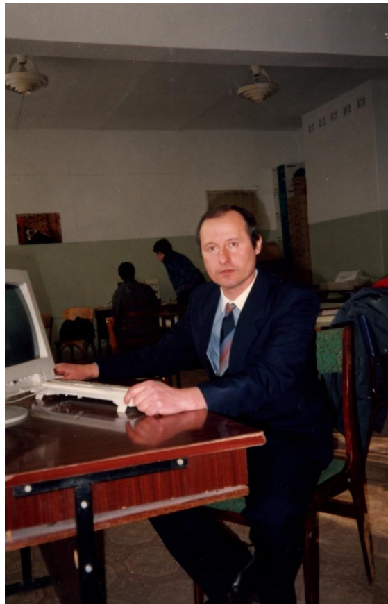
На кафедрі інженерних та інформаційних технологій у Національній фармацевтичній академії, 1999 р.