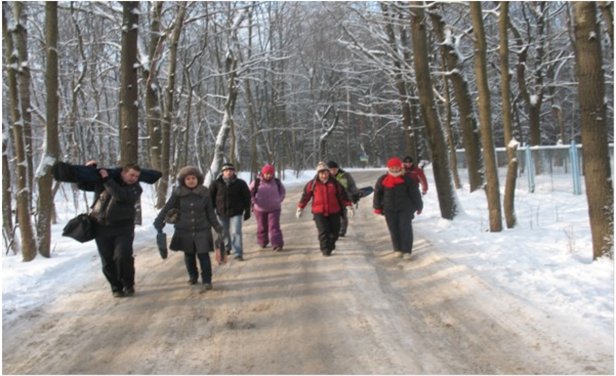
Активний відпочинок зимою