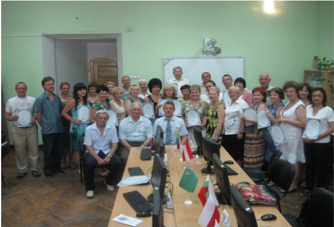
Вручення дипломів про закінчення курсів інформатики для директорів ПТУ м. Харкова та Харківської області