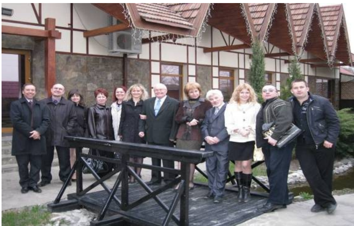
Виїзне засідання кафедри