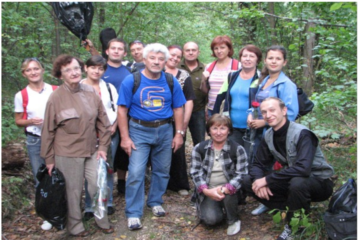
... і влітку