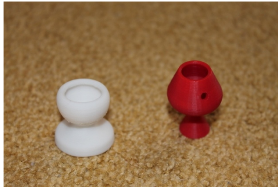
Рис. 3. Фізичні моделі, виконані на 3d принтері

Основна задача складається в математичній ідеї кожного прототипу і передачі цієї ідеї просто і зрозуміло, наскільки це можливо. Побудовані моделі можуть використовуватися надалі для демонстрації досягнень учнів.